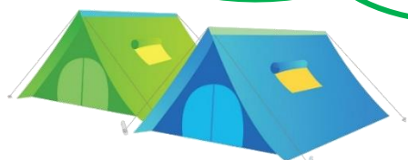
テント設営・テント泊

青少年の家で過ごす3泊4日！ いろいろなことにチャレンジしよう！ その中で、自然と触れ合い、仲間と協力し、 たくさんの思い出を作ろう！ 成長した新しい自分に会えるはずだよ♪